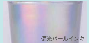
偏光パールインキ